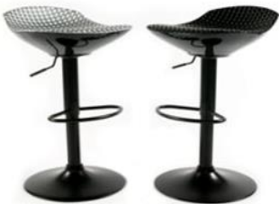
KC-25 에어스틀 6 (실버&블랙)

사진신청 현장신청 W430 x D400 x H750mm ₩35,000 ₩38,500