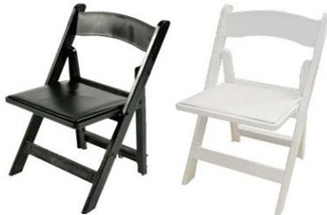
KC-23 맥스의자 (블랙&화이트)

사진신청 현장신청 W580 x D580 x H850mm ₩15,000 ₩16,500