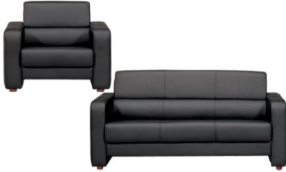
KC-20 #1 소파(1인 & 3인) (블랙)

사진신청 현장신청 W760 x D780 x H750mm ₩60,000 ₩66,000 W1900 x D780 x H750mm ₩100,000 ₩110,000