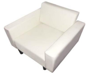
KC-20 #2 소파(1인) (아이보리)

사진신청 현장신청 W760 x D720 x H770mm ₩60,000 ₩66,000