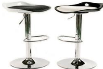
KC-26 에어스틀 7 (블랙&화이트)

사진신청 현장신청 W430 x D400 x H750mm ₩35,000 ₩38,500