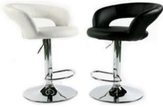
KC-15 에어스틀 3 (블랙&화이트)

사진신청 현장신청 W530 x D470 x H450mm ₩40,000 ₩44,000