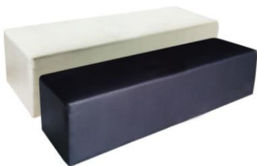
KC-27 #2 스틀(3인) (블랙&화이트)

사진신청 현장신청 W1600 x D400 x H400mm ₩50,000 ₩55,000