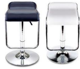
KC-24 해리스틀의자 (블랙&화이트)

사진신청 현장신청 Ø600 x H700~870mm ₩30,000 ₩33,000