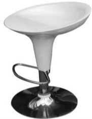
KC-22 에어스틀 4

사진신청 현장신청 W430 x D400 x H750mm ₩25,000 ₩27,500